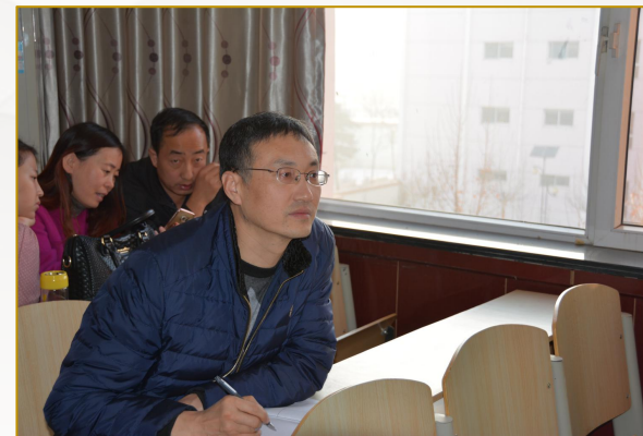
认真记录讲座要点